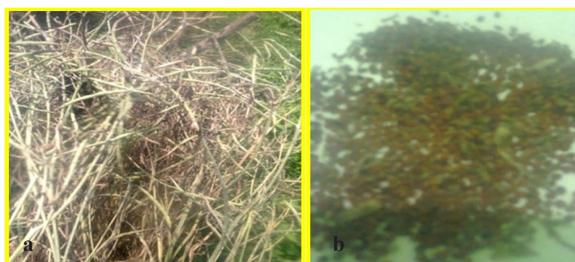
Gambar 3. Benih kubis bunga siap panen (a) dan biji kubis yang siap digunakan (b) [Cauliflower seed ready to harvest (a) and cauliflower seed ready to use (b)]

penanaman ( N_1 = tanpa naungan dan N_2 = menggunakan naungan). Penetapan dosis pupuk Boron diambil dari hasil penelitian Simatupang (1997) dan Darwin (1992) yang menyatakan bahwa produksi kubis bunga terbaik dihasilkan menggunakan dosis pupuk Boron 15 kg/ha dan 25 kg/ha. Prosedur yang dilakukan adalah benih disemai pada bumbun daun pisang. Setelah bibit berumur 25–30 hari atau berdaun empat, bibit dipindahkan ke lapangan. Bibit ditanam pada petak percobaan dengan ukuran lebar 1 m dan panjang 3 m, dengan jarak tanam 60 cm x 50 cm. Jarak antarperlakuan 60 cm, jarak antarulangan 100 cm. Dalam petak percobaan terdapat dua baris tanam dan dalam satu baris tanam terdapat lima tanaman. Pemeliharaan berupa penyiraman dilakukan secara rutin setiap 2 hari. Pupuk dasar yang diberikan adalah pupuk kandang ayam 200 g/tanaman dan pupuk anorganik dengan dosis N 200 kg/ha, P_2O_5 150 kg/ha, dan K_2O 125 kg/ha. Pupuk N diberikan dua kali, yaitu pada saat tanam dan setelah tanaman berumur 1 bulan. Pupuk P dan K diberikan seluruhnya pada saat tanam. Pemberian Boron dilakukan tiga kali, yaitu pada saat umur 1, 2, dan 3 bulan setelah tanam (BST) dengan dosis sesuai perlakuan. Pupuk Boron yang digunakan berasal